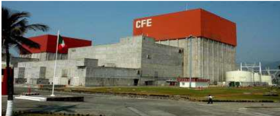
Laguna Verde, Veracruz.

La energía que requiere el mundo se puede generar mediante avanzados procesos nucleares : el ya existente de “ fisión nuclear ” , o mediante un futuro proceso, actualmente todavía en desarrollo experimental , que busca obtener energía por “ fusión nuclear ” . México cuenta con dos reactores nucleares que utilizan la tecnología de fisión nuclear donde se separan los núcleos para formar núcleos más pequeños, liberando energía. Entre ambos reactores se generan 1604 MW, que representan el 3.2% de la energía total del país. Ambos reactores se encuentran en las instalaciones de Laguna Verde, Veracruz , siendo propiedad nacional de la Comisión Federal de Electricidad (CFE) . Se les conoce como Laguna Verde Central 1 y Laguna Verde Central 2.