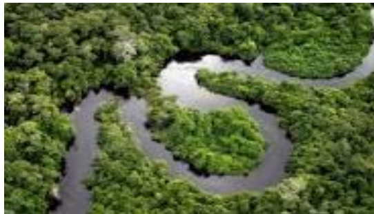
La pluviselva tropical Amazónica

El “bosque húmedo tropical” del ecosistema amazónico sudamericano, más usualmente referido como selva lluviosa, o pluriselva , es un tipo de bioma caracterizado por una formación vegetal arbórea alta y densa, que agrupa diversos ecosistemas propios de climas tropicales o subtropicales. La cuenca fluvial amazónica, aunque parece superficialmente uniforme, es el ecosistema que contiene más especies de plantas y animales por unidad de superficie (y también en total) que cualquier otro lugar del planeta. Este húmedo y cálido ecosistema alberga unas 80,000 especies vegetales (de las cuales 600 son palmeras) y posiblemente unos 30 millones de especies animales, insectos en su mayoría.