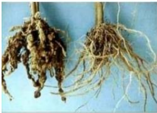
Raíces afectadas por el nematodo Meloidogyne spp.

Aphelenchoides fragariae . Este nematodo ocasiona el rizado o "enchinamiento" de las hojas de la fresa. Varias especies de este género de nematodos se asocian con pudriciones de la raíz del aguacatero, algodónero y otros cultivos.