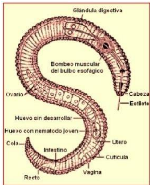
Diagrama de un Típico Nematodo, Parásito de Plantas

Los nematodos ectoparásitos que no entran en las raíces se pueden recuperar sólo de muestras de suelo. Los nematodos endoparásitos a menudo se detectan más fácilmente en las muestras de los tejidos en los que se alimentan y viven. Los endoparásitos, que están dentro de tejidos de la raíz, pueden estar protegidos de nematicidas que no penetran en las raíces, tales como algunos fumigantes del suelo. Los tejidos de la raíz también pueden protegerlos de muchos microorganismos que atacan a los nemátodos en el suelo. Los ectoparásitos están totalmente expuestos a los plaguicidas y agentes de control naturales en el suelo.