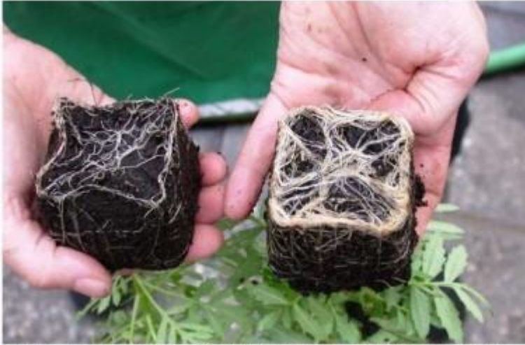
Raíces no micorrizadas (izquierda); raíces micorrizadas (derecha).

El origen etimológico del término "micorriza" proviene del griego "mykos" (hongo) del vocablo latino "rhiza" (raíz). Se dice que las micorrizas son asociaciones simbióticas mutualistas entre las raíces de las plantas terrestres y ciertos hongos del suelo. Su existencia se conoce desde 1885, pero fueron consideradas curiosidades