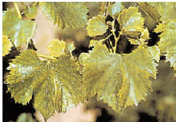
Deficiencia de Zn

Cuando existe carencia de Zn, el crecimiento de los tejidos nuevos se afecta. Las hojas nuevas son pequeñas, distorsionadas y presentan un moteado amarillento, sin embargo, las nervaduras mantienen una delgada faja de color verde a su alrededor, a menos que la deficiencia sea muy severa.