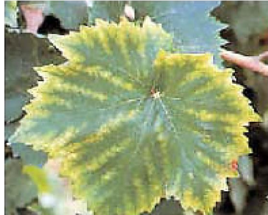
Deficiencia de Mg

Los síntomas de deficiencia de Mg se inician con un amarillamiento de las hojas bajas, que generalmente aparece a mediados de ciclo de crecimiento y progresa hacia arriba a medida que avanza el ciclo. El amarillamiento aparece primero en los filos de la hojas y se mueve hacia adentro entre las nervaduras primarias y secundarias, sin embargo, el color verde normal permanece en los bordes de las nervaduras. Luego, el área clorótica toma un color amarillo blanquecino, los márgenes de las hojas se queman y en las variedades de fruta coloreada aparece un borde rojizo inmediatamente adentro del borde quemado.