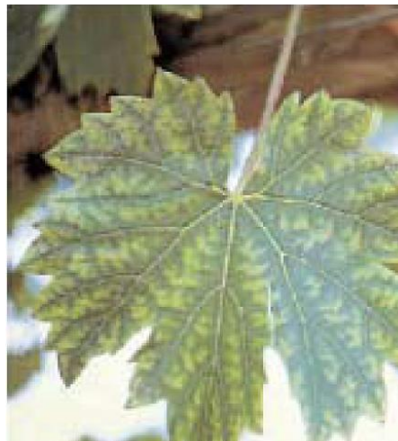
Deficiencia de Mn

Los síntomas se inician en las hojas viejas como un amarillamiento entre las nervaduras. La clorosis es más acentuada en las nervaduras primarias y secundarias dando la apariencia de espina de pescado.