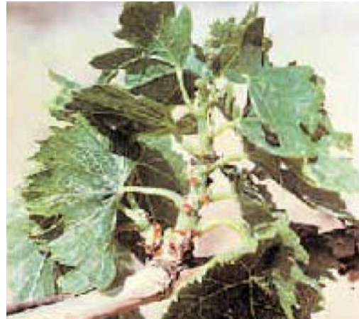
Deficiencia de B

Funciones del B en la planta El B interviene en muchos procesos fisiológicos de la planta como el transporte de azúcares, síntesis y estructura de la pared celular, lignificación, metabolismo de carbohidratos, metabolismo del RNA, AIA, fenoles y ascorbatos, respiración e integridad de la membrana plasmática. Entre las diversas funciones atribuidas al B en las plantas, dos están claramente definidas. Estas son la síntesis de la pared celular y la integridad de la membrana plasmática. El B es absorbido del suelo como borato [B(OH)_4^-] y ácido bórico ( H_3BO_3 ).