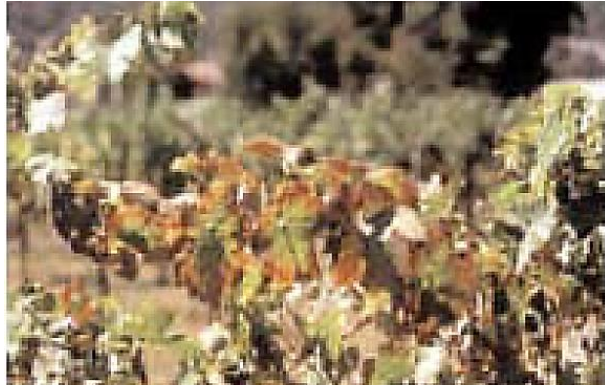
Síntomas de deficiencia de K

Los síntomas aparecen primero en las hojas de las porciones medias de las ramas como un amarillamiento que se inicia en los filos de las hojas. A medida que el ciclo de crecimiento progresa, el amarillamiento se mueve hacia las áreas entre las nervaduras. En las variedades de color oscuro este amarillamiento cambia a un color rojo bronceado. Luego, en todas las variedades, los filos de la hojas se queman y se curvan hacia arriba o hacia abajo.