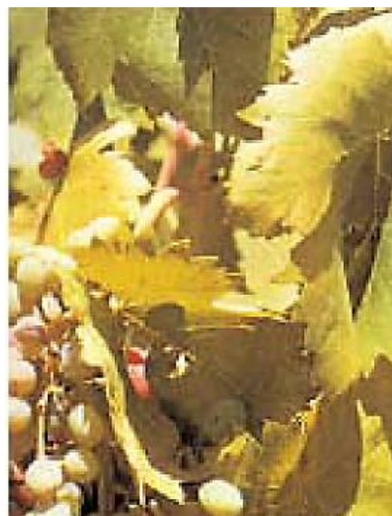
Severa deficiencia de N

La deficiencia de N no aparece fácilmente hasta que la carencia de este nutriente en la planta es severa. Cuando esta condición se presenta las hojas muestran un color que va de verde pálido a amarillento que se distribuye uniformemente en las hojas. Además, se reduce el crecimiento del tallo y el viñedo demuestra una apreciable reducción en el vigor de las plantas. El rendimiento de la uva no se incrementa inmediatamente después de la aplicación de N. En viñedos con bajo contenido se observa respuesta en crecimiento de la planta a la aplicación de N, pero la respuesta en rendimiento será evidente solamente en el siguiente ciclo de producción. Se debe tener en cuenta que problemas como ataque de nemátodos, mal manejo del riego o compactación del suelo pueden también producir plantas débiles, aun cuando el N no sea un factor limitante.