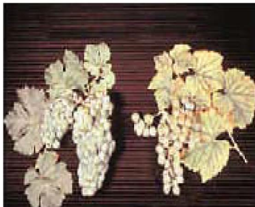
Efecto de la deficiencia de P

Las necesidades de P en el viñedo son mucho menores que las de N y K, por esta razón la presencia de síntomas de deficiencia no es muy frecuente. Sin embargo, la falta de P afecta el crecimiento radicular y el crecimiento total de la planta. Las hojas son pequeñas con un amarillamiento que se inicia en las hojas viejas y la fruta es también pequeña. Cuando la deficiencia es severa las hojas toman un color rojizo.