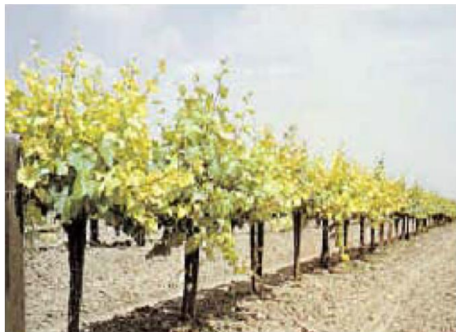
Deficiencia de Fe

El Fe participa en la activación de varios sistemas enzimáticos en la planta. Una carencia de Fe interfiere con la producción de clorofila. El Fe se transporta en la planta como Fe^{2+} a los sitios de uso donde se combina con proteínas para formar compuestos orgánicos complejos.