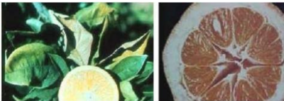
Imagen 2.- Deficiencias de Fósforo en limón persa.