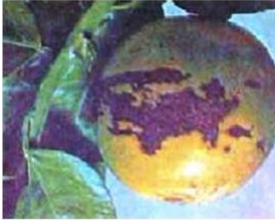
Imagen 8.- Deficiencias de Cobre en limón persa.