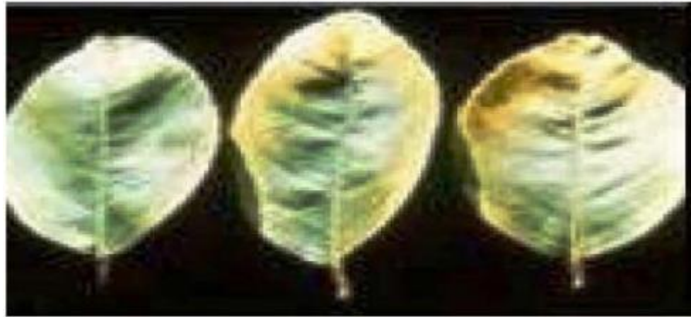
Imagen 4.- Deficiencias de Calcio en limón persa.

- Al inicio ocurre un amarillamiento en la orilla de las hojas jóvenes maduras que luego avanza del borde hacia el interior de la hoja. (Ver Imagen 4).