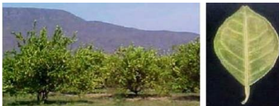
Imagen 1.- Deficiencias de Nitrógeno en limón persa.