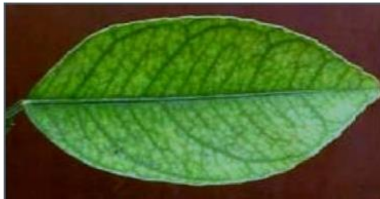
Imagen 7.- Deficiencias de Hierro en limón persa.