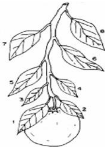
Figura 1. Localización de hojas para el muestreo foliar en cítricos. Las hojas 1, 2 y 3 son las que se deben tomar. Las hojas 4, 5, 6, 7 y 8 son más viejas; no se deben tomar para el análisis. (Chapman, 1960)

La muestra se recomienda enviarla a Laboratorios A-L de México por la vía más rápida (DHL, Estafeta, etc.). Los resultados se entregan por vía e-mail, fax o mensajería, en un plazo no mayor a 9 días hábiles desde que llega la muestra a Laboratorios A-L de México.