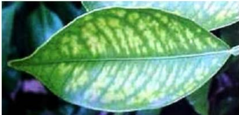
Imagen 9.- Deficiencias de Manganeso en limón persa.