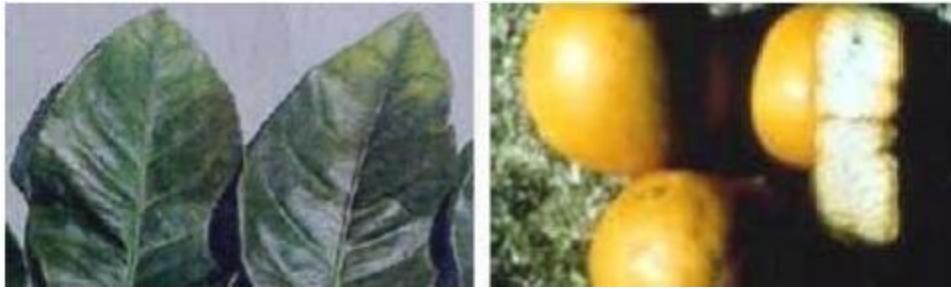
Imagen 3.- Deficiencias de Potasio en limón persa.