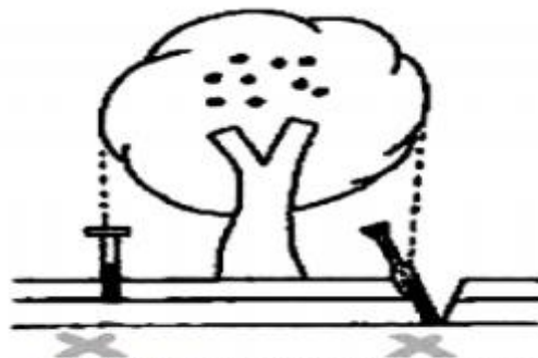
Figura 2. Localización de zona para tomar el muestro de suelo en cítricos. "Food & Fertilizer Technology Center", 5F,14 Wenchow St., Taipei 10616 Taiwan R.O.C.

Posición de la muestra de suelo. Hay que tomarlas directamente debajo del árbol. Dos muestras de suelo por separada deben ser tomadas, una de la capa superficial del suelo y una del subsuelo. (Ver Figura 2).