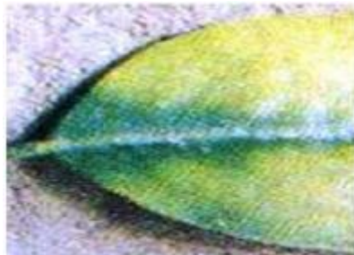
Imagen 5.- Deficiencias de Magnesio en limón persa.

- En las hojas viejas aparecen pequeñas áreas amarillentas en ambos lados de la nervadura central. - Con una fuerte deficiencia se conserva solo una parte verde en la base de las hojas en forma de una "V" invertida. (Ver Imagen 5).