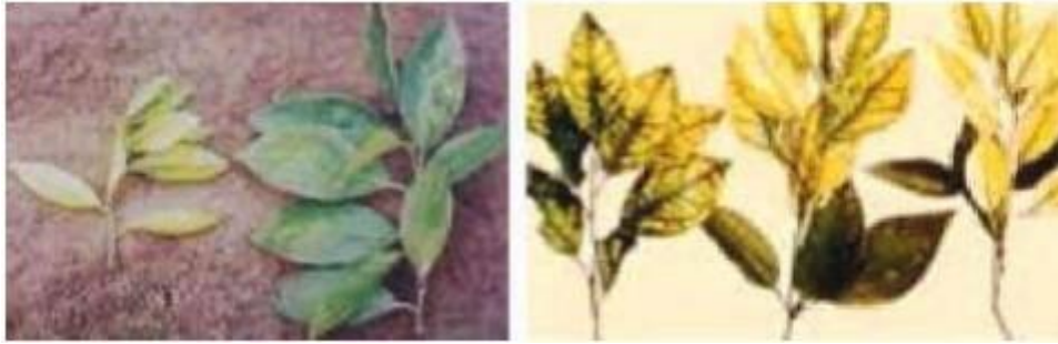
Imagen 6.- Deficiencias de Zinc en limón persa.