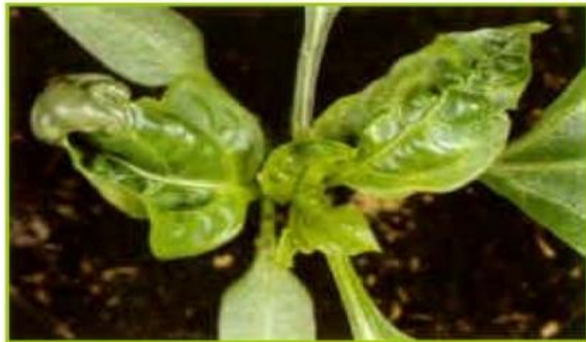
Deficiencia de Boro en chile