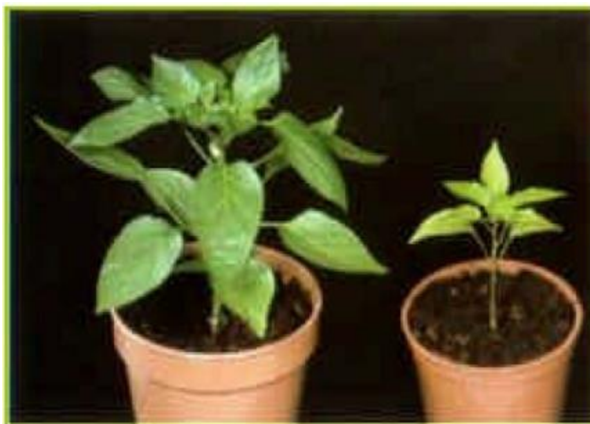
Deficiencia de Nitrógeno en chile