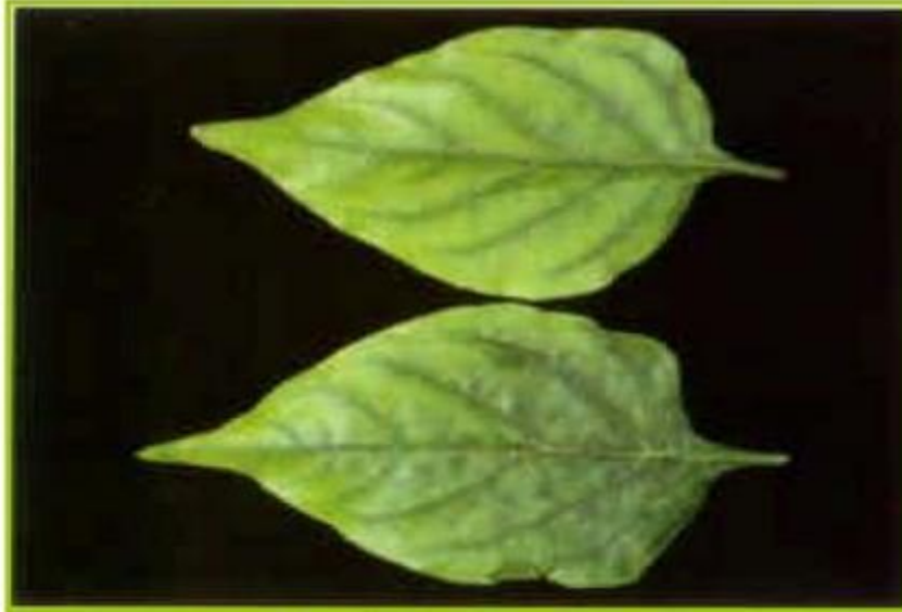
Deficiencia de Magnesio en chile