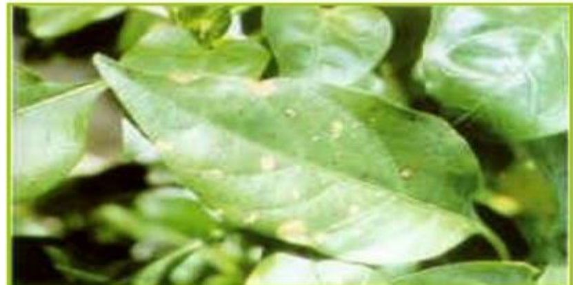
Deficiencia de Zinc en chile