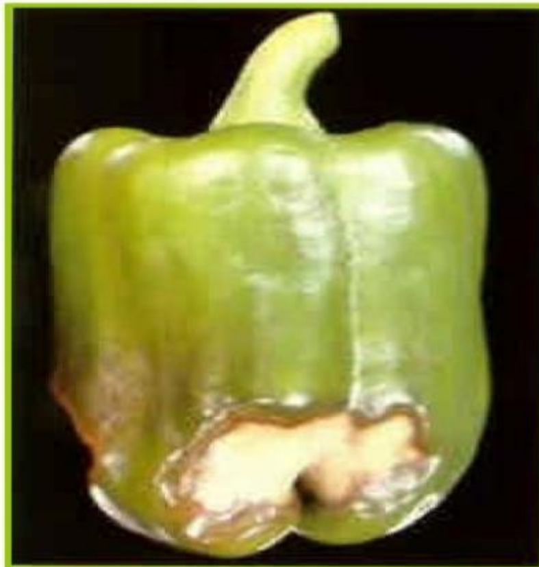
Deficiencia de Calcio en chile