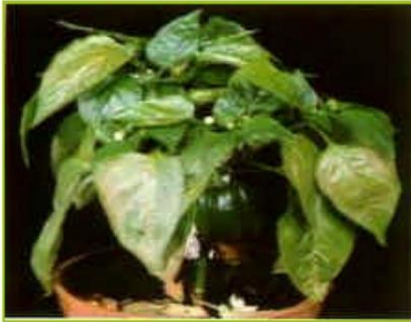
Deficiencia de Potasio en chile